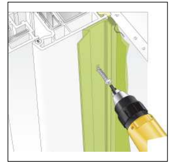
Bild2: Befestigung mit geeigneten Schrauben.