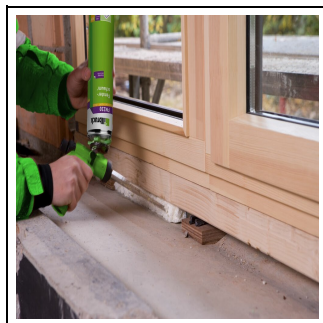
2.Bild: Verarbeitung der Fensteranschlussfuge mit FM220.